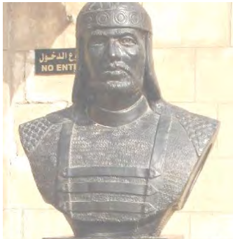
Turkish Sultan Al Zaher Beybars - 1260-77 A.D.

Tarihimiz, Mısır’dan İstanbul’a kadar Türk Emirlerinin haçlılara karşı gönüllü savaşan kahramanlarla doludur. Kafkaslardan köle olarak güneye getirilip satılmış askerlerden biri olan Baybars’la başlayan Doğu Akdeniz’de var olmuş Kölemen Memlûk Türk devletinde kölelikten gelme asker kökenli Türk cengaverler yönetici oldular. Venedikli Haçlılarla ve Cengiz Han’ın yağmacı ordularıyla savaşarak halkı korudular. Aşağıda iki Türk kökenli sultanın Mısır’da bulunan heykeli görülmektedir.