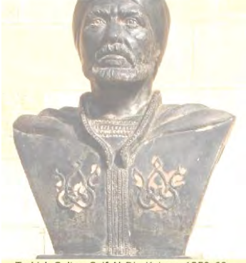
Turkish Sultan Seif Al-Din Kutuz - 1259-60

Alt yazı: Türk Sultanı Saip Aladdin Kutuz.